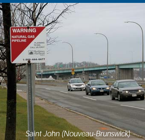
Saint John (Nouveau-Brunswick)

Des spécialistes à notre centre de contrôle de l'acheminement du gaz surveillent en permanence le débit du gaz tout au long du gazoduc, de manière à détecter une chute de pression dans le système. Dans l'éventualité peu probable où une chute de pression rapide ou importante serait constatée dans une zone urbaine, les vannes en amont et en aval de l'incident seraient immédiatement fermées, limitant ainsi la quantité de gaz naturel susceptible de s'échapper.